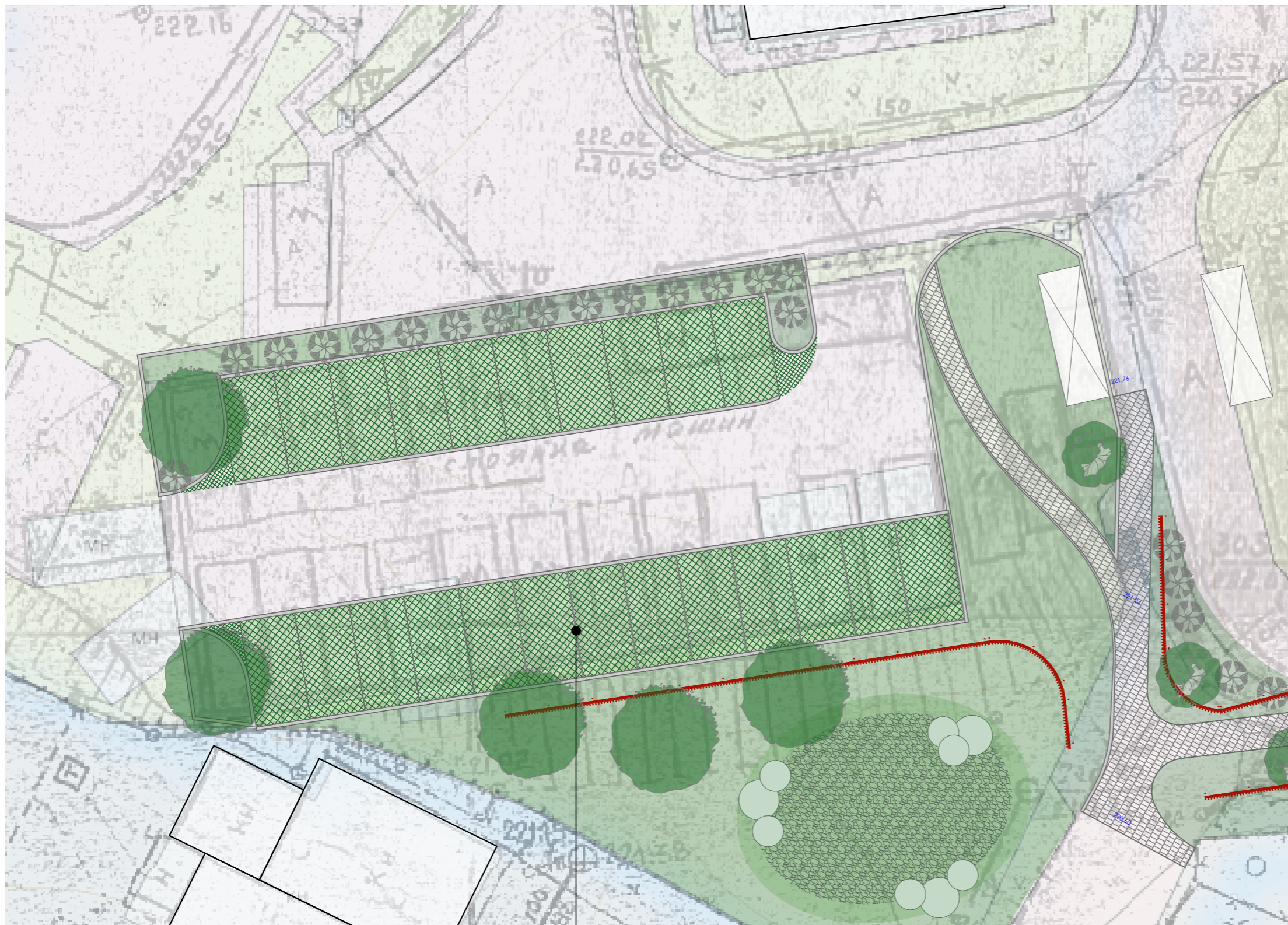
влаштування екобруківки зі щебенем, або відсіву замість частини існуючого асфальтного покриття